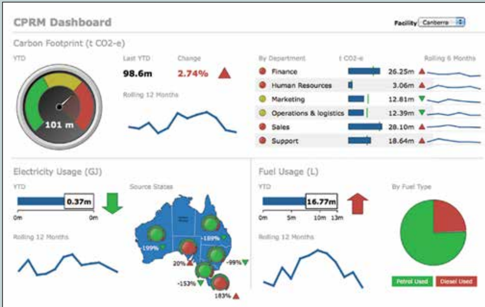
Grafieken, diagrammen en kaarten geven snel inzicht in trends en uitschieters van uw data

De Diver Solution laat snel zien wat de trends en uitschieters zijn in uw data, dankzij de grafische mogelijkheden op het dashboard. Interactieve kaarten, metertjes, bullets-gewijze opsommingen, trendlijnen, taartdiagrammen, staafdiagrammen en meer, bieden een visuele samenvatting van voor u relevante data.